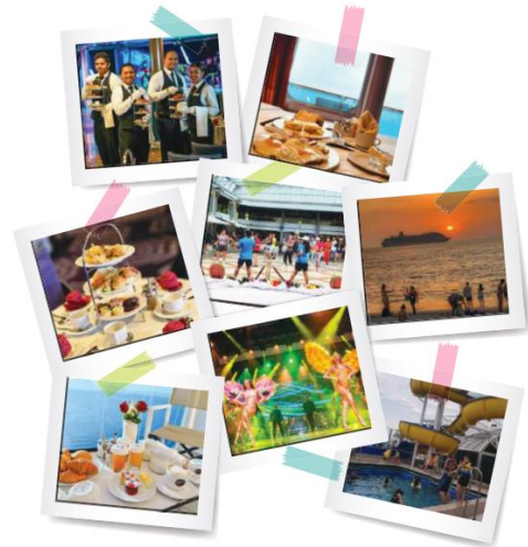
Squok Club Kid's club and activities

ค่ำ รับประทานอาหารค่ำ ตามห้องอาหารที่ทางเรือจัดให้ หลังจากนั้น ท่านสามารถรับชมการแสดงที่ห้องโชว์หลัก หรือดนตรีสดตามบาร์ต่างๆทั่วทั้งลำเรือ หลังจากนั้นพักผ่อนตามอัธยาศัย **เรือจะมีใบแจ้ง สถานที่และเวลาที่ห้องพักของท่านเพื่อให้ท่านรับหนังสือเดินทางคืน** ช่วงค่ำ เรือจะมีแท็กกระเป๋าและกำหนดการลงจากเรือให้ท่านในห้องพักของท่าน ให้ท่านนำกระเป๋าเดินทางของท่านวางไว้หน้าห้องเพื่อให้พนักงานนำลงไปที่ท่าเรือในวันรุ่งขึ้น(สิ่งของที่ท่านจำเป็นต้องใช้ระหว่างวันให้ท่านแยกใส่ในกระเป๋าถือ ) ** ถ้าท่านใดมีความประสงค์จะถือกระเป๋าเดินทางลงด้วยตนเองไม่จำเป็นต้องวางไว้ที่หน้าห้องพัก**